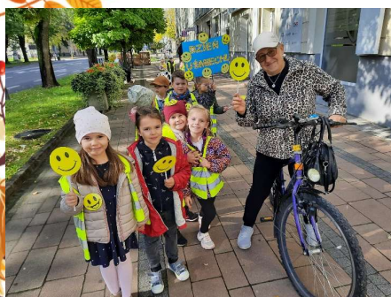
ŚWIATOWY DZIEŃ UŚMIECHU