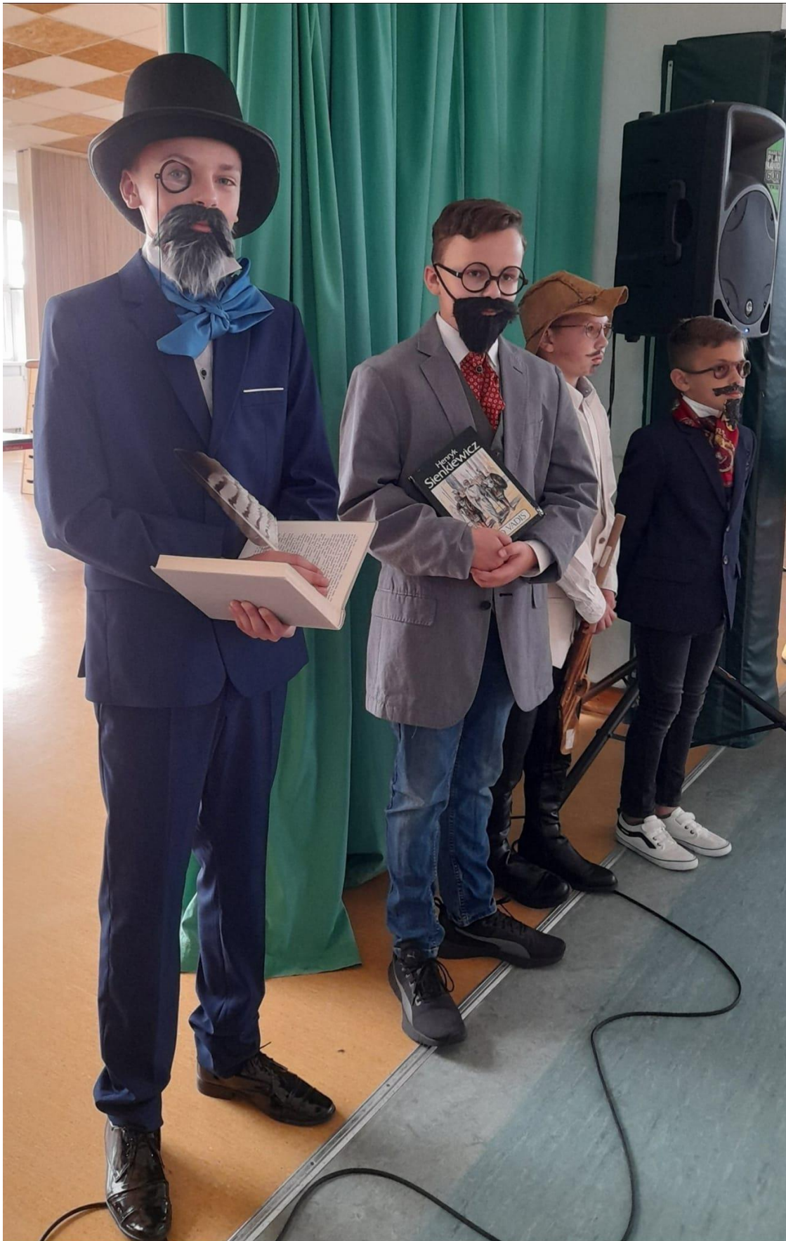
Zjawiło się kilku sobowtórów Henryka Sienkiewicza