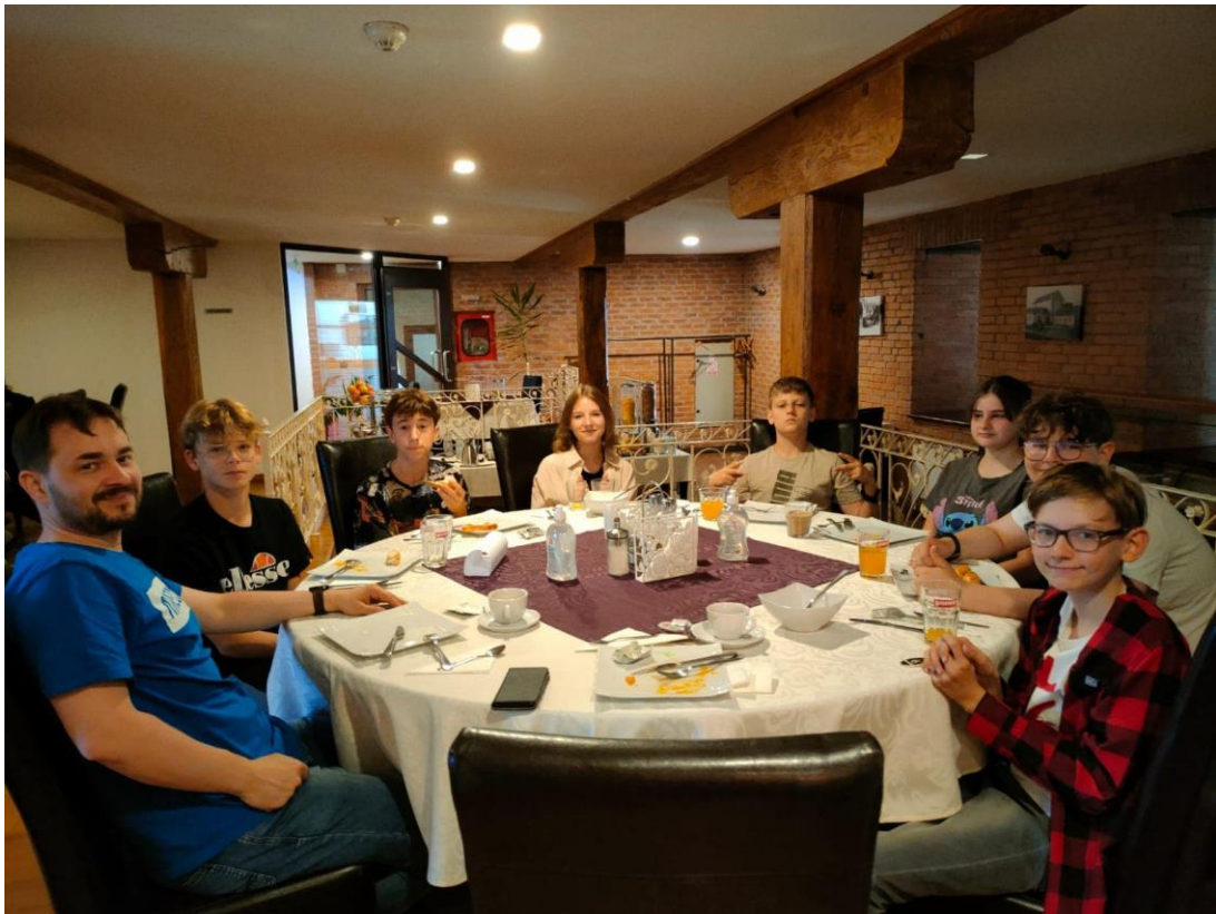
Przy śniadaniowym stole