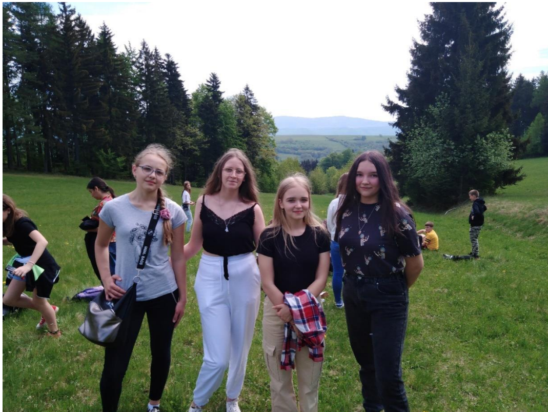
Podziwialiśmy piękne krajobrazy