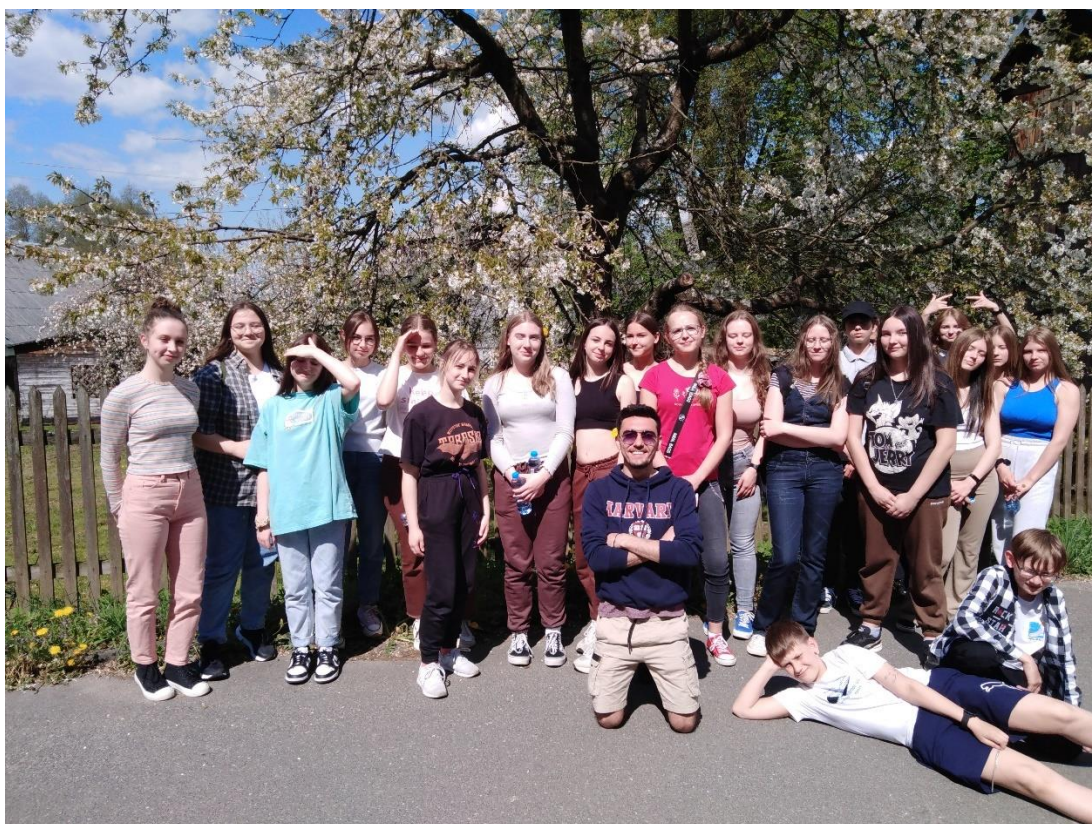
Podziwialiśmy piękno tamtejszej wiosny z wolontariuszami