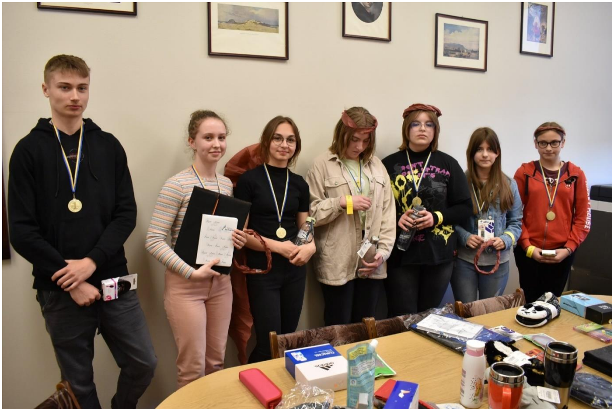
Najlepsi zostali nagrodzeni medalami i upominkami