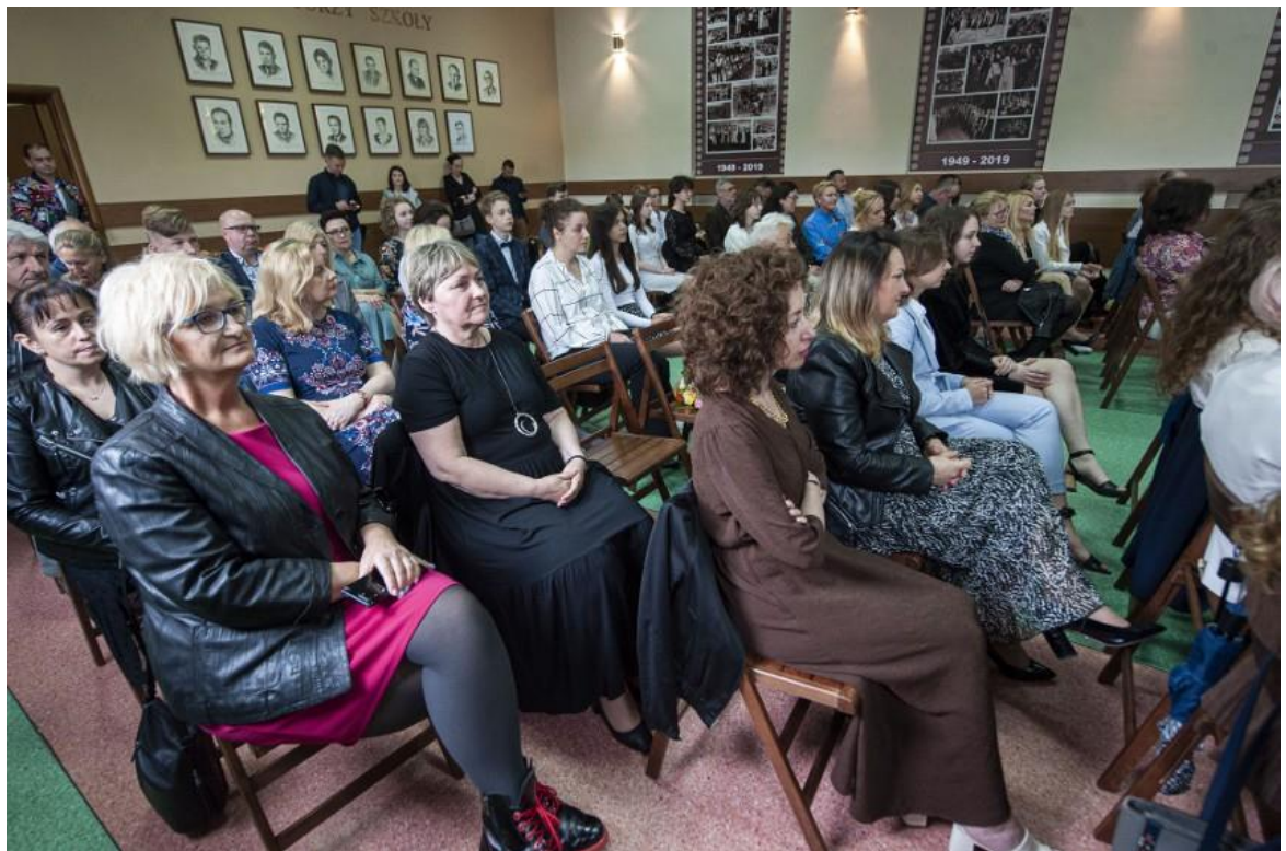
Laureatkom towarzyszyli Rodzice i opiekunowie