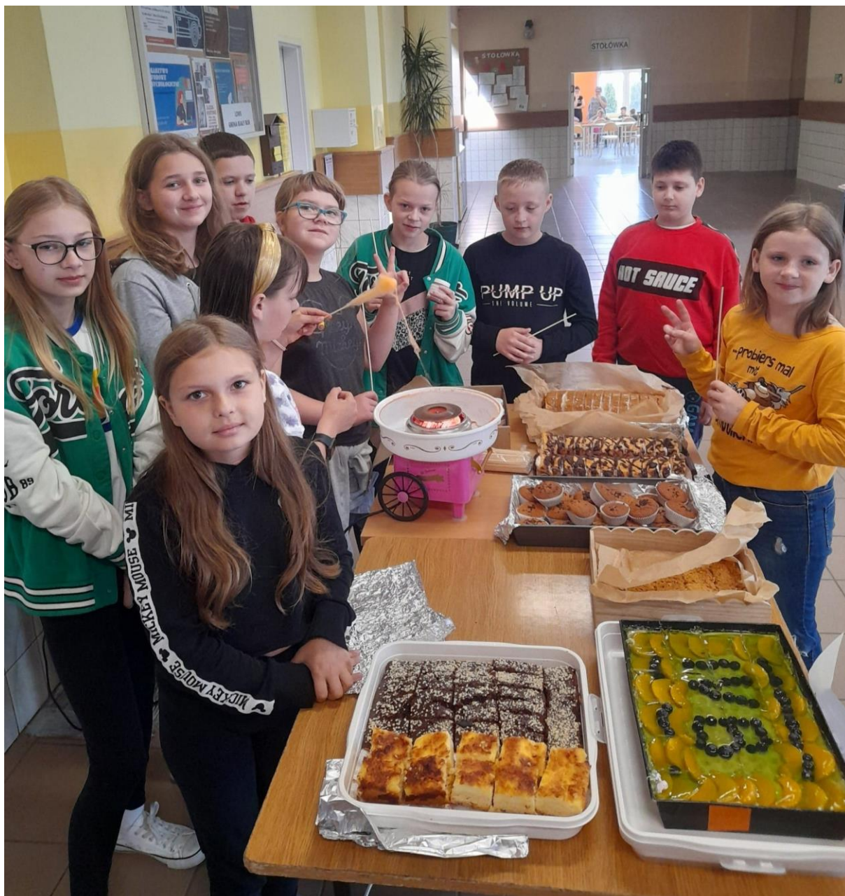
Stoisko klasy IV b zachęcało kupujących