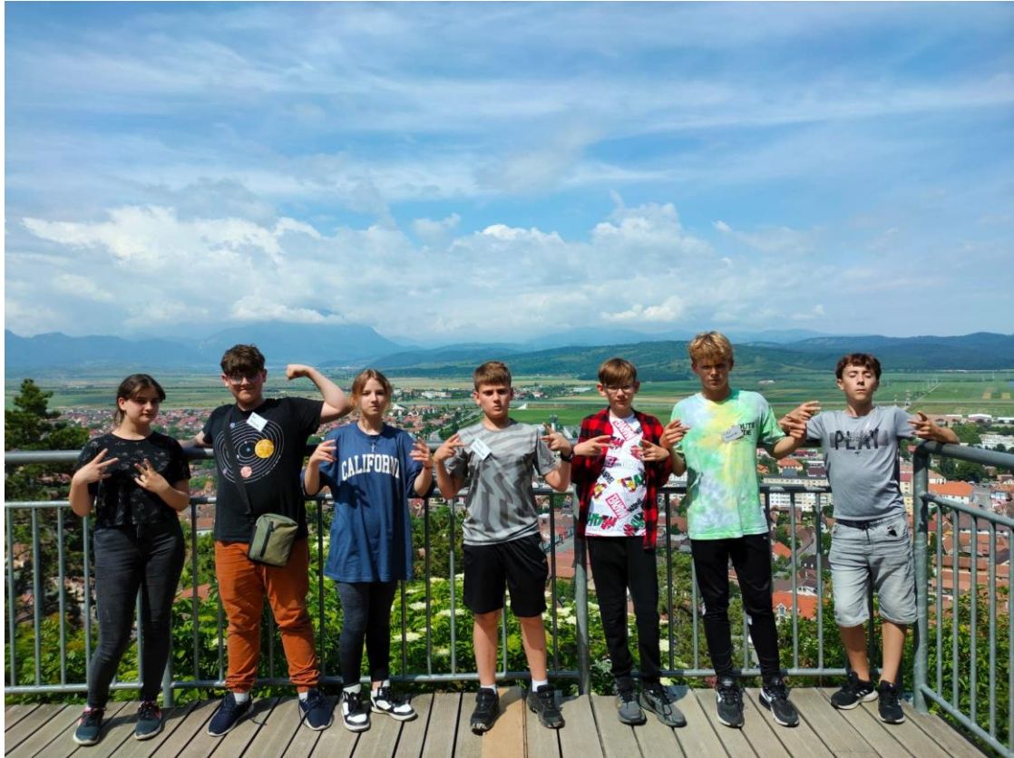
Dużo czasu spędzali na zwiedzaniu