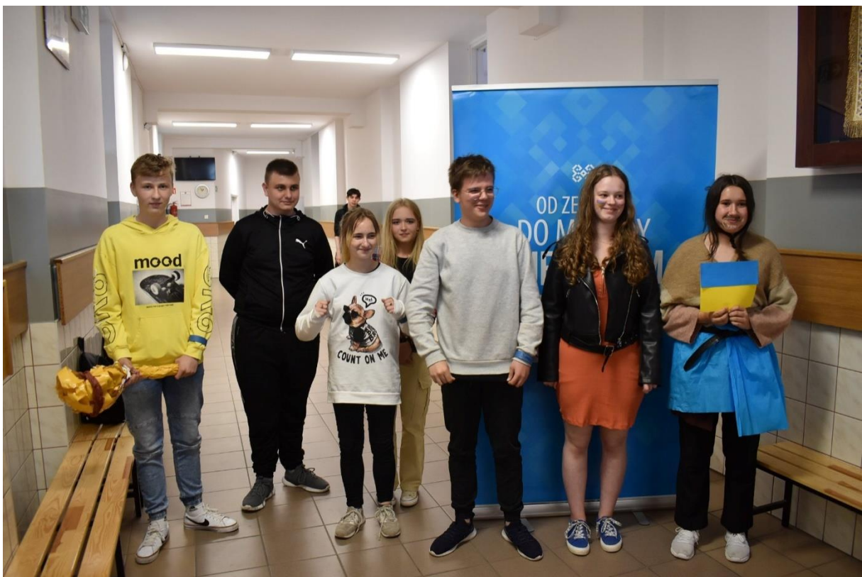
Na koniec każda grupa prezentowała swoje umiejętności