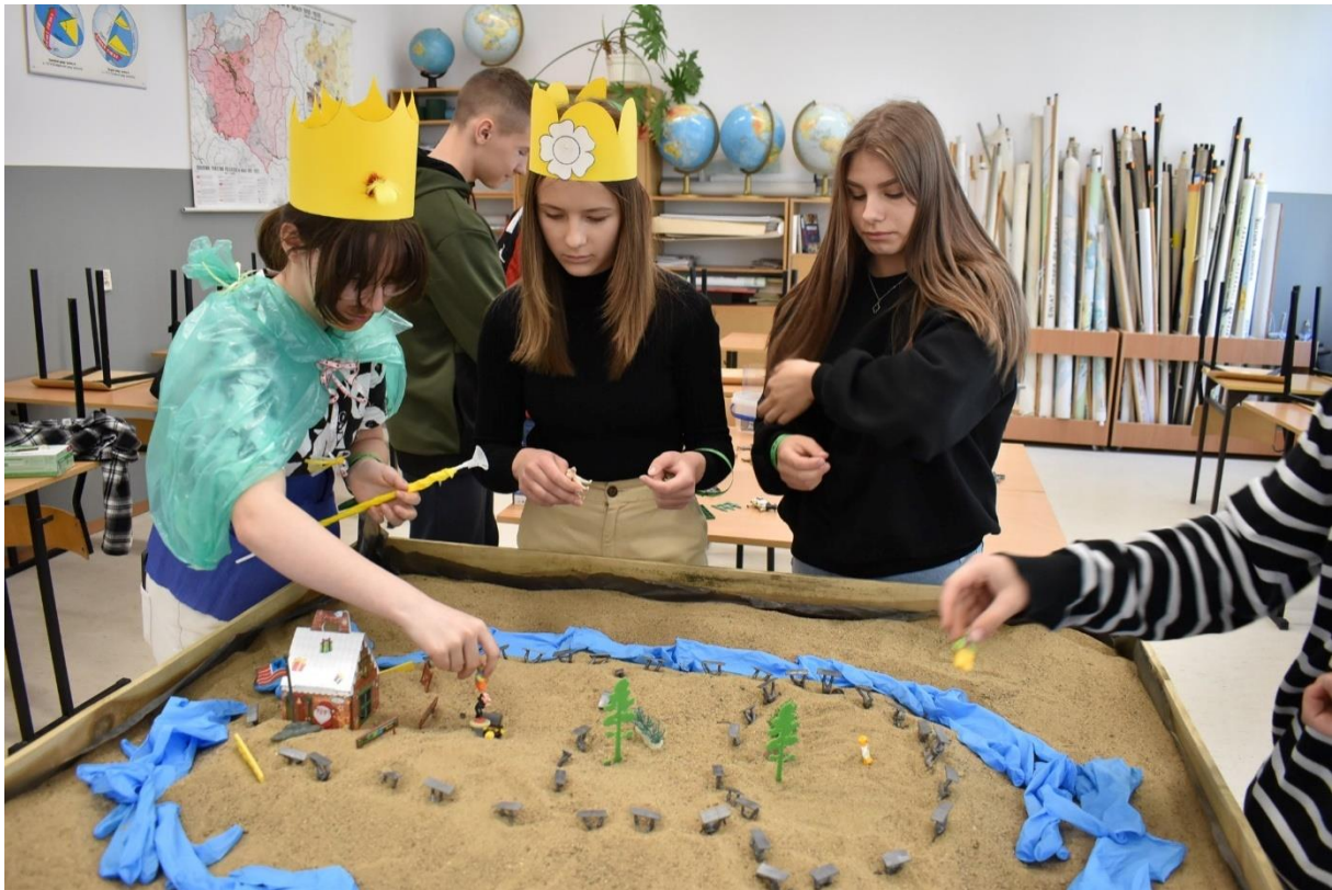
Dziewczyny w skupieniu przygotowują plan bitwy