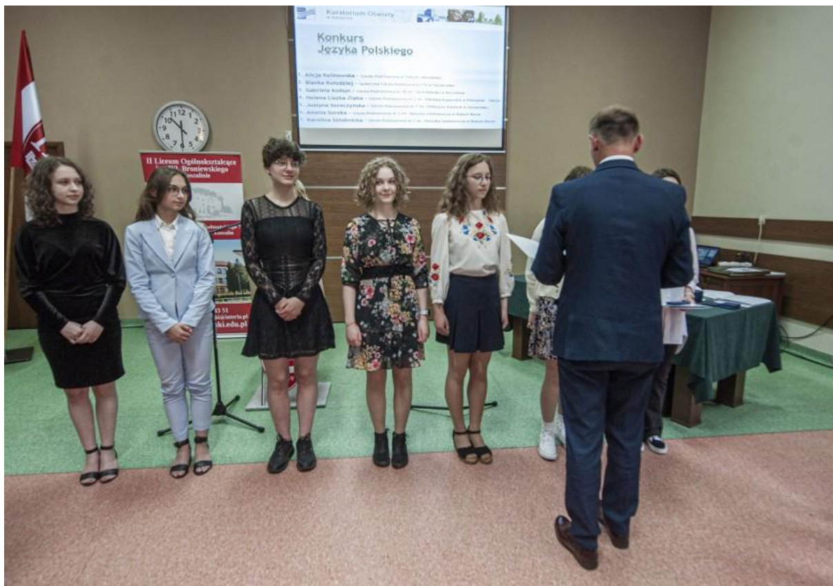
Wręczenie dyplomów laureata za konkurs z języka polskiego