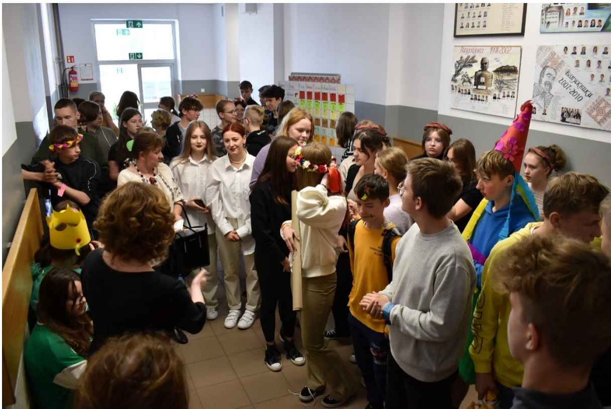
Pani Dyrektor ogłasza wyniki rywalizacji zespołów