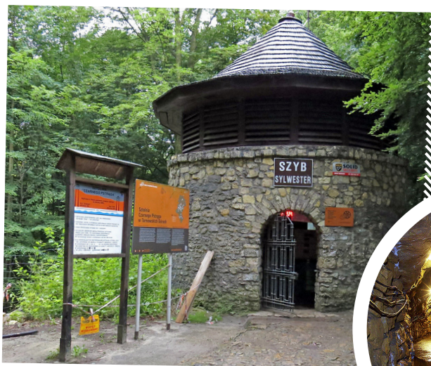
Wejście do Sztolni Czarnego Pstrąga – Tarnowskie Góry