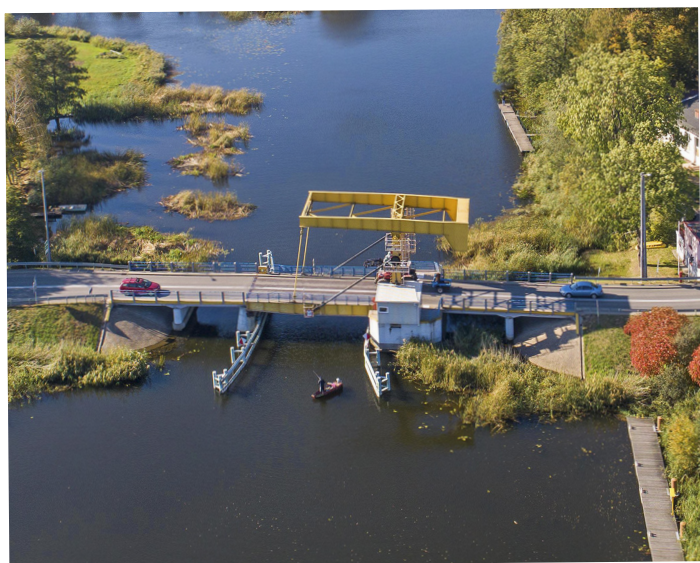
Most obrotowy w Rybinie