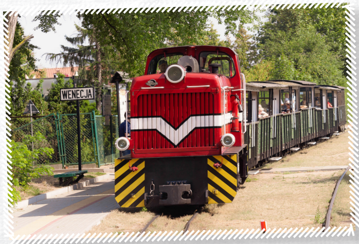
Wąskotorowa Żnińska Kolej Powiatowa