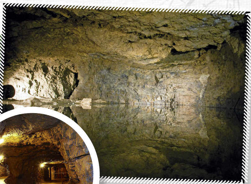
Korytarze Sztolni Czarnego Pstrąga