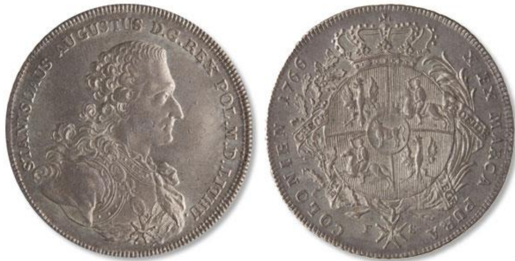
Talar koronny Stanisława Augusta Poniatowskiego, Warszawa 1766 r.